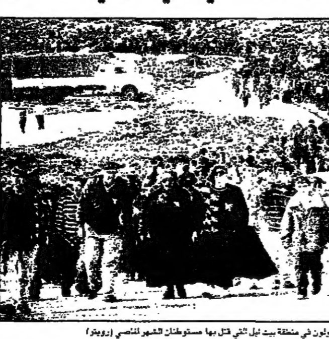
الآن المستوطنون يتحشرون في منطقة بيت ايل قبل بدء مسيراتهم للتعبير عن غضبهم

تفاهم فلسطيني اسراييلي بالافراج عن المعتقلات واستئناف المفاوضات بشأن المعتقلين. وسيحدث الخوضات الاسرائيلية فيما يتعلق بالمعتقلين والمعتقلات الذي وحسب اتفاق طابا يتوجب اطلاق معظم المعتقلين في ثلاث مراحل يبدأ اولها فور التوقيع على الاتفاق.